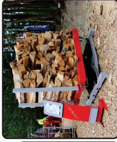
MASĂ RIDICĂTOAR LANCMAN 2001 - TTH